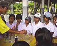
ชมการผลิตปุ๋ยชีวภาพ

ส่วนสุดท้ายที่นำจัดกิจกรรมท่องเที่ยวเชิงเกษตรครบทุกขั้นตอน โดยแบ่งเป็นฐานความรู้ 3 ฐาน ดังนี้