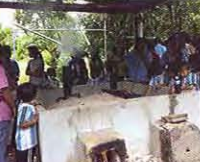
ชมการผลิตน้ำส้มควันไม้