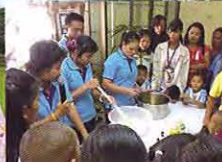
สาธิตการแปรรูปผลไม้