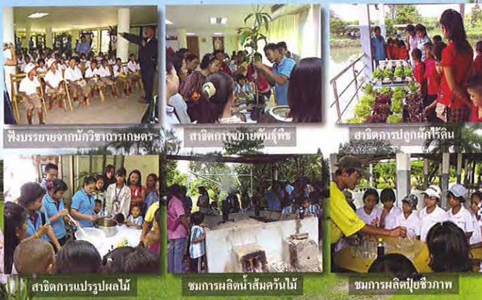
ฟังบรรยายจากนักวิชาการเกษตร

เพื่อชีวิตดำรงอยู่อย่างมีความสุขและหยุดการทำร้ายทรัพยากรธรรมชาติ